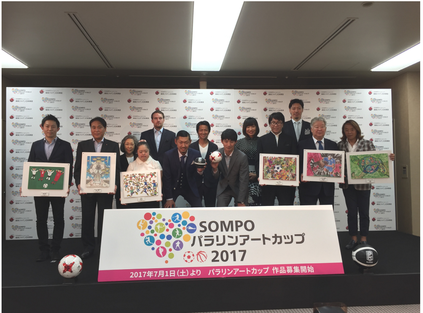
「SOMPO パラリンアートカップ2017」開催発表会の様子（6月27日@有楽町朝日スクエア）

当社は、お客さまの「安心・安全・健康」に資する最高品質のサービスを提供し、社会に貢献するというグループ経営理念の実現に向けた取組みの一環として、「SOMPO パラリンアートカップ2017」に参画しています。今年度も47都道府県毎に入賞作品を表彰する損保ジャパン日本興亜賞を贈呈するなど、障がい者の社会参加の一助を担うとともに文化・芸術の振興に取り組んでいきます。